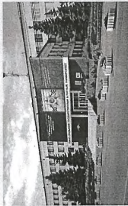
Институт ветеринарной медицины г.Троицк