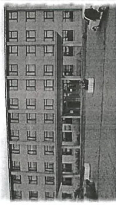
Троицкий аграрный техникум г.Троицк