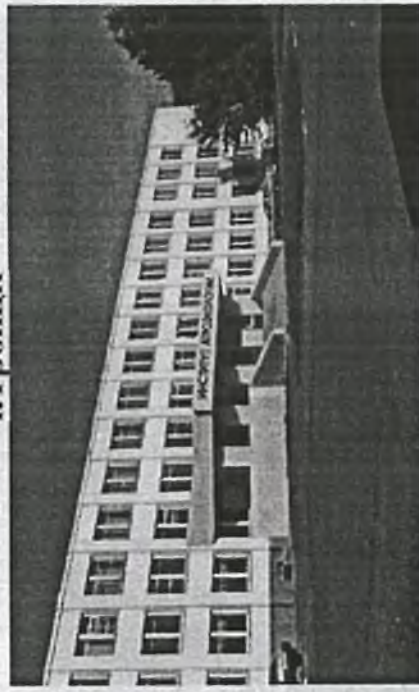
Институт агроэкологии с.Миасское